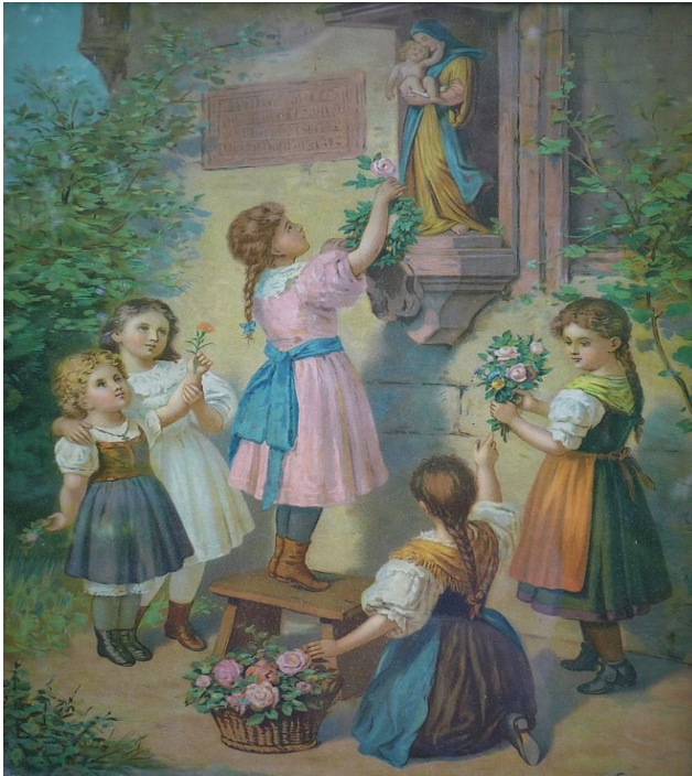
Religiöses Erbauungsbild vom Ende des 19. Jahrhunderts zur Propagierung der Ehrung Marias im Mai durch floralen Schmuck